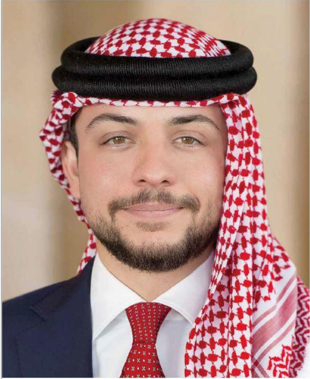
صاحب السمو الملكي الأمير الحسين بن عبد الله الثاني – ولي العهد المعظم

"لا بد من تحقيق طموح الشباب من خلال تحصينهم بالتعليم النوعي وفرص العمل المناسبة".